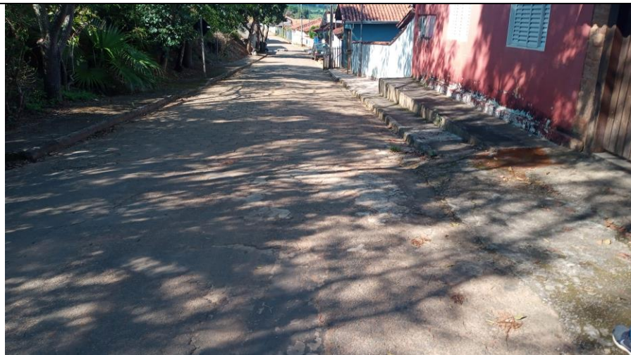
Final do recapeamento (08/03/24)